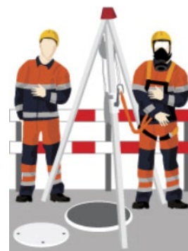
Rys. 2. Trójnóg ewakuacyjny